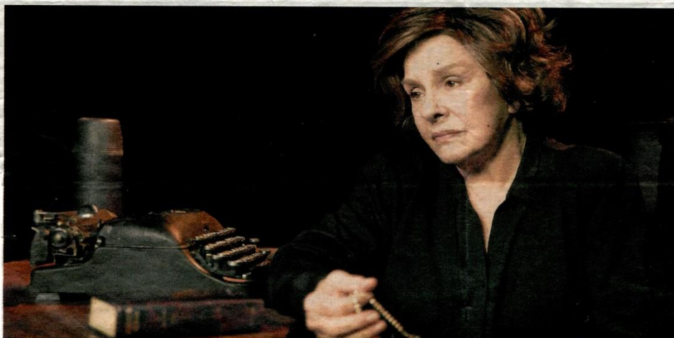
Lola Herrera, en una escena de «Cinco horas con Mario»