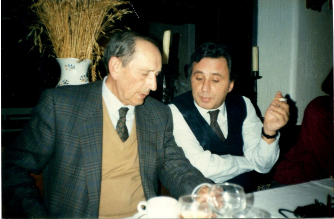
Miguel Delibes y José Sámamo, a mediados de los años 80, en uno de los múltiples encuentros hablando de aspectos de sus adaptaciones teatrales.